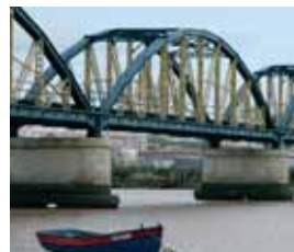
Ponte ferroviária (1915)

Nas estacas que se observam nos diques que marginam o rio encontram-se ora guinchos (Inverno) ora chilretas (Verão). Pode ainda observar várias aves limícolas como os perna-vermelha ou os maçaricos-das-rochas. É possível também observar garças-brancas, garças-reais e com um pouco mais de sorte a rara garça-vermelha, bem como águias-de-asa-redonda a voar em círculos para aproveitarem as correntes ascendentes de ar quente, enquanto procuram por presas no solo.