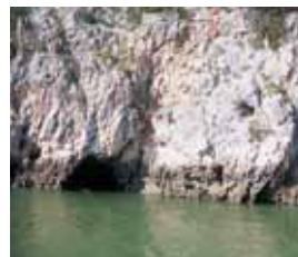
Gruta velha das castanhas