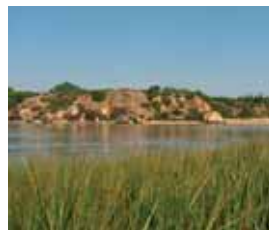
Quinta da Rocha

Além das aves, os animais mais comuns nas dunas são micro-mamíferos e os seus predadores raposa e ouriço-cacheiro. Existem também alguns répteis como o sardão, a lagartixa-de-dedos-denteados e a cobra-de-escada.