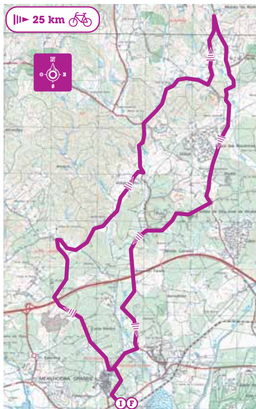
Mapa do Percursos 4