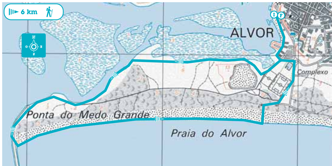
Mapa do Percurso 2