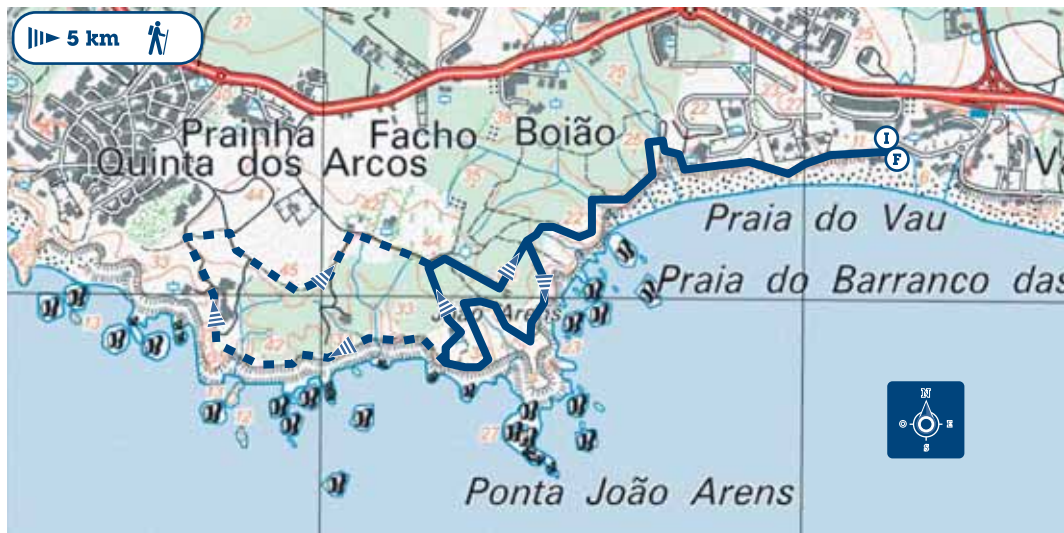
Mapa do Percurso 3