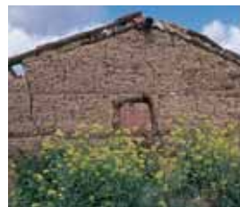
Construção tradicional em taipa e adobe