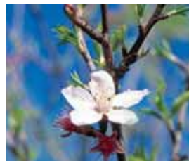
Flor da Amendoeira

A Ria de Alvor é porto de abrigo para numerosas espécies, com destaque para as aves. Enquanto que na Primavera e Verão poderá encontrar chilretas e pernalongos a nidificar, no Inverno o sapal é utilizado por aves que fugiram ao rigor do Inverno das latitudes mais elevadas como os perna-vermelha, borrelhos-grandes-de-coleira, milherango, alfaíates e flamingos.