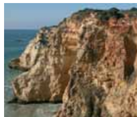
Abarracamentos ou ravinas

No decorrer desta caminhada encontrará matos mediterrânicos com lentiscos e pinheiros-mansos dispersos, onde poderá também travar conhecimento com diversas aves, como a toutinegra-dos-valados e o pisco-de-peito-ruivo.